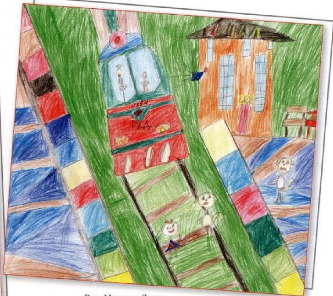
Рис. Маслова Дарья, НОУ «Школа-интернат № 23 ОАО «РЖД»